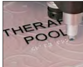
ADA Braille Alfabeti